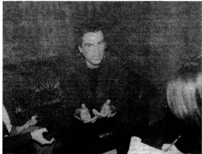
Sopra, lo scrittore durante l'incontro con gli studenti. Nella pagina che segue, ancora una foto di Andrea De Carlo

E mi piace ricordare che anche il mio bisnonno aveva delle origini siciliane, per cui è come se, in piccola parte, anch'io finissi per appartenere a questa terra magica». Non ci resta che essere soddisfatti. Anche una città come la nostra apparentemente opaca, nota per i clamori improvvisi degli scandali e le risonanze salaci della corruzione, qualche volta non manca di svelare il suo fascino. E di suscitare ammirazione, desiderio, attrazione. Di farsi, in altri termini, patria di pensiero.